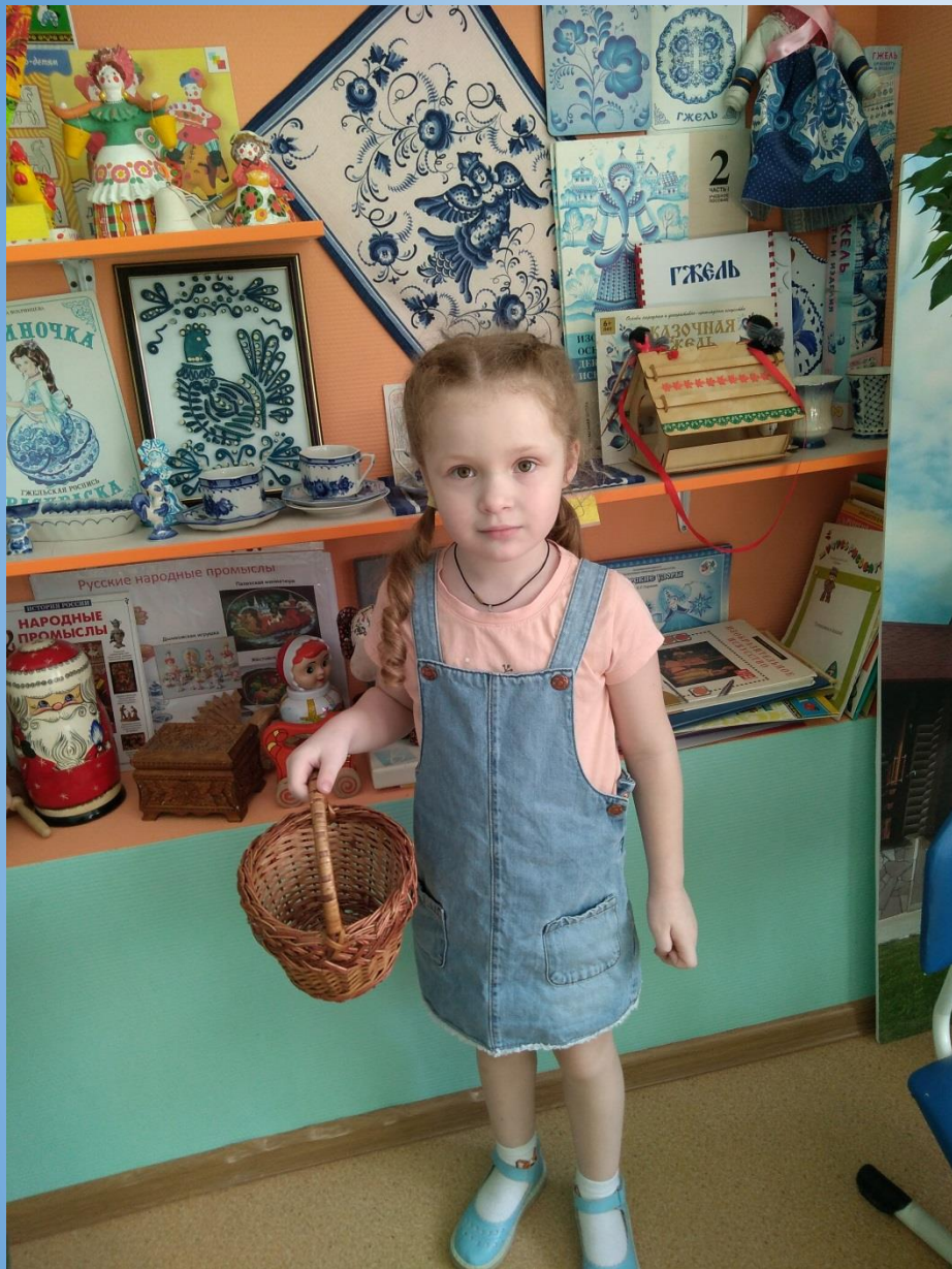
Экскурсии в музей